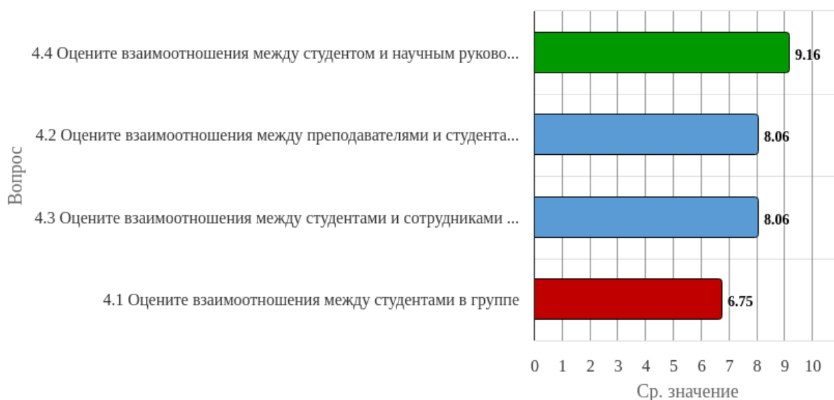
Рисунок 2.4.1 - Распределение показателей уровня удовлетворенности всех респондентов по блоку вопросов «Удовлетворенность взаимоотношениями в коллективе»

Индекс удовлетворенности по блоку вопросов «Удовлетворенность взаимоотношениями в коллективе» равен 8.01.