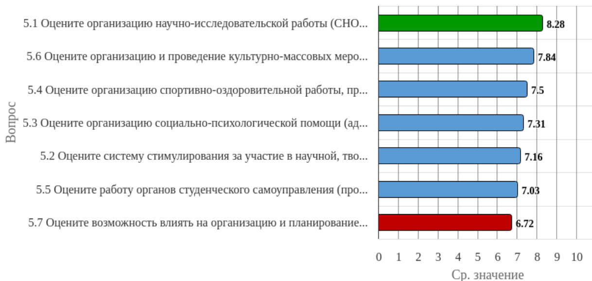
Рисунок 2.5.1 - Распределение показателей уровня удовлетворенности всех респондентов по блоку вопросов «Удовлетворенность организацией внеучебной деятельности»

Индекс удовлетворенности по блоку вопросов «Удовлетворенность организацией внеучебной деятельности» равен 7.41.