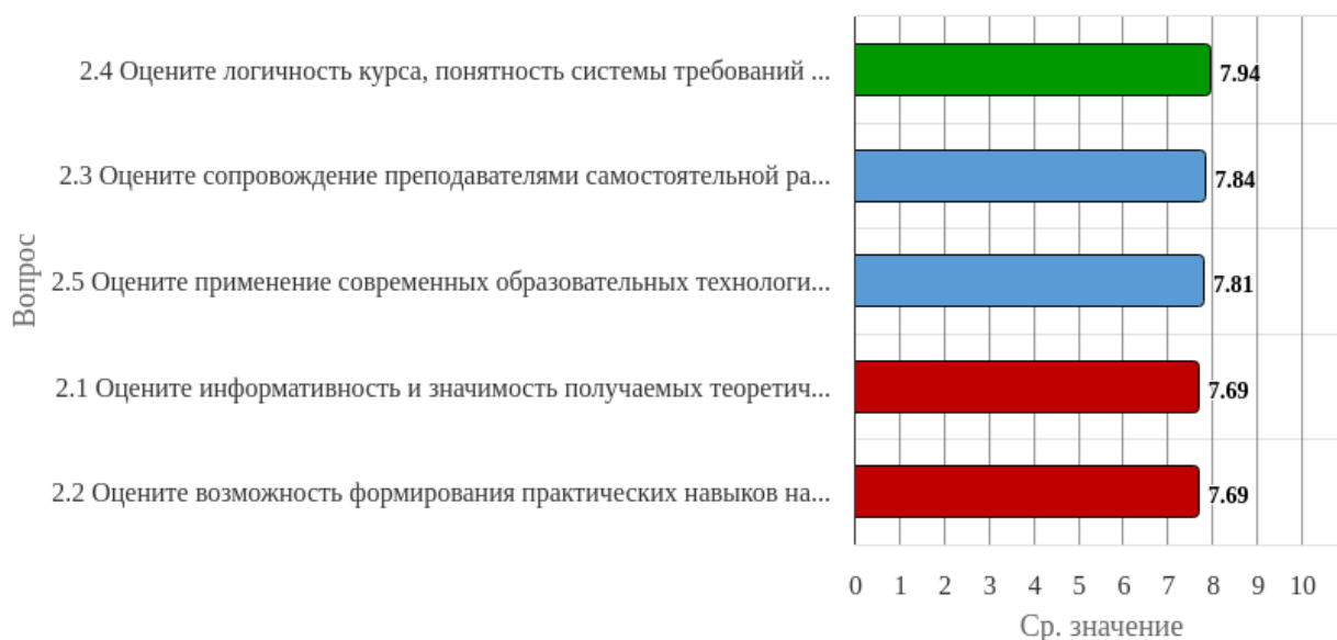
Рисунок 2.2.1 - Распределение показателей уровня удовлетворенности всех респондентов по блоку вопросов «Удовлетворенность содержанием изученных дисциплин»

Индекс удовлетворенности по блоку вопросов «Удовлетворенность содержанием изученных дисциплин» равен 7.79.